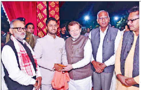
महेंद्रगढ़। लगन समारोह में वर पक्ष को आशीर्वाद देते सहकारिता मंत्री।