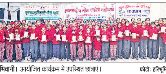
भिवांनी। आयोजित कार्यक्रम में उपस्थित छात्राएं।