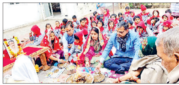
महेन्द्रगढ़। विद्यालय में हवन करते हुए।