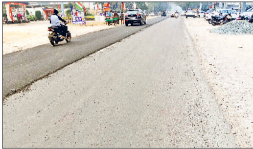
नारनौल। नीरपुर रोड पर डाली जा रही नई लेयर व रेवाड़ी रोड, जिस पर है डिवाइडर एवं फोरलेन की जरूरत।