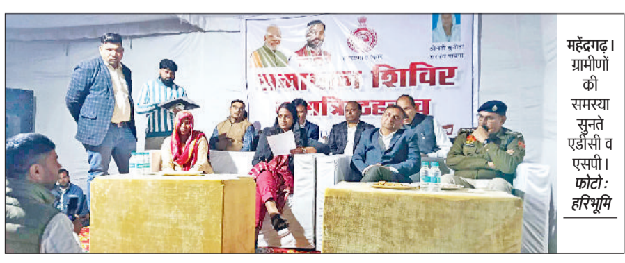
महेन्द्रगढ़। ग्रामीणों की समस्या सुनते एडीसी व एसपी।

जन स्वास्थ्य विभाग पायगा गांव की पेयजल से संबंधित समस्याओं का जल्द से जल्द समाधान करें। यह बात अतिरिक्त उपायुक्त उदय सिंह ने गांव में आयोजित समाधान शिविर व रात्रि ठहराव कार्यक्रम में ग्रामीणों की समस्याएं सुनते समय कहा। अतिरिक्त उपायुक्त ने कहा कि हरियाणा सरकार की सुशासन