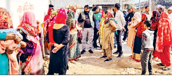
भिवांनी। अधिकारियों को समस्याओं की निराकरण के निर्देश देते हुए।