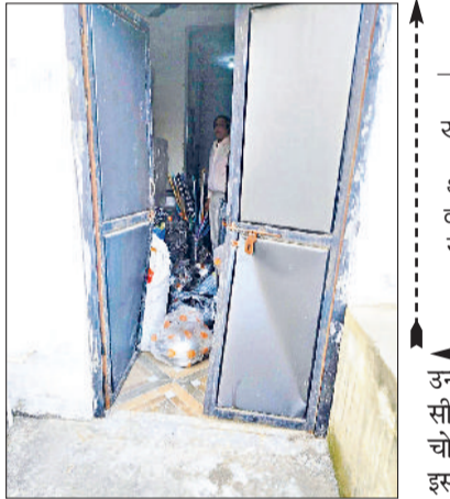
नांगल चौधरी। अज्ञात चोरों द्वारा चौबारों के तोड़े गए दरवाजे।