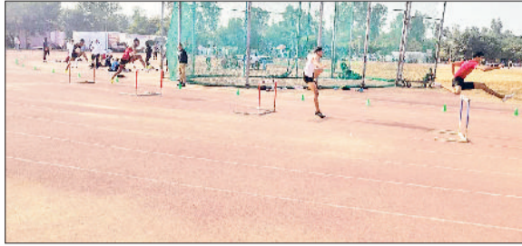
भिवांनी। बाधा दौड़ पार करते प्रतिभागी।