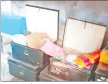
नारनौल। चोरी के बाद बिखरा पड़ा सामान।

उन्होंने बताया कि चौबारा की सीटियों में सीसीटीवी कैमरे लगे हुए हैं, लेकिन अज्ञात चोरों ने चेहरा छुपाकर कैमरे का उखाड़ दिया। इसके बाद सुविधा पूर्वक वारदात को अंजाम दिया गया है। सुबह दुकान खोलने पर पूरा सामान इधर उधर बिखरा हुआ मिला। संदेह होने पर गल्ले को चेक किया। जिसमें नकदी गायब मिलने पर पुलिस को सूचना दी गई है। थाना इंचार्ज ने विभिन्न तकनीकी उपकरणों की मदद से वारदात को ट्रेस करने की प्रक्रिया आरंभ कर दी।