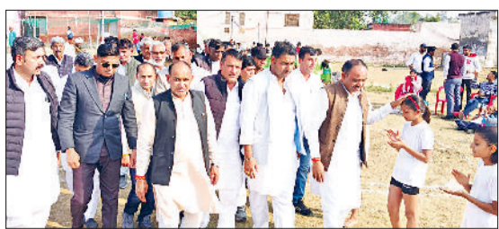
बवानीखेड़ा। खिलाड़ियों का परिचय लेकर खेलकूद प्रतियोगिता शुरू करवाते विधायक।