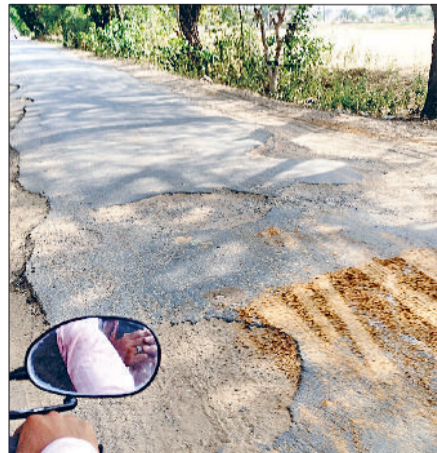
कनीना। गुढ़ा को लिंक करने वाली क्षतिग्रस्त सड़क।

बता दें कि कनीना में अटेली सड़क मार्ग पर रेवाड़ी, सादुलपुर रेलवे लाइन पर बनाए जा रहे आरओबी के कारण दर्जनभर गांवों के ग्रामीण व वाहन गुढ़ा से गुजर रहे हैं। बढ़ते यातायात दबाव के कारण सड़क बदहाल हो चुकी है। इसके अलावा कनीना महेंद्रगढ़ सड़क मार्ग एनएच 152 डी बुचावास तक कमोबेश टूट चुका है। रामपुरी रजवाहे उन्हाणी के समीप लीकेज साइफन तो सिंचाई विभाग के विश्राम गृह के समीप डोहान नदी के पानी से सड़क खंडित हो चुकी है। इसी प्रकार दौंगड़ा अहीर से अटेली व महेंद्रगढ़ मार्ग जर्जर हो चुका है। नांगल मोहनपुर के समीप सड़क पर गंदा पानी जमा हो