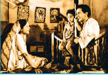
बिमल राय की यथार्थपरक फिल्म 'दो बीघा जमीन'