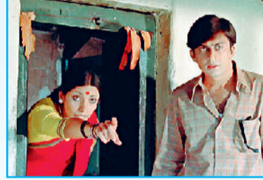
श्याम बेनेगल की 'अंकुर' में दिखा जीवन यथार्थ

दिखाई है जीवन का यथार्थ: समानांतर सिनेमा में जीवन और समाज का यथार्थ बहुत गहराई से दिखाया जाता रहा है। यह हिंदी सिनेमा का वह पक्ष है, जिसमें आम आदमी के जीवन की जद्दोजहद, सामाजिक असमानता और बदलाव को दर्शाया जाता है। फिल्मों के कथानक में यथार्थ को पूरी शिद्दत के साथ प्रस्तुत करने का यह चलन 1950 के दशक में पश्चिम बंगाल से शुरू हुआ और बाद में इसे हिंदी समेत हर भाषा के सिनेमा ने अपनाया। इसका मकसद जीवन के