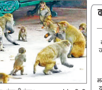
नारनौल। बंदर ही बंदर।